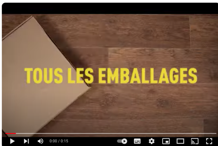
Extension des consignes de tri - été 2023

La vidéo la plus vue de l'année : www.youtube.com/watch?v=j4K01m4ulal