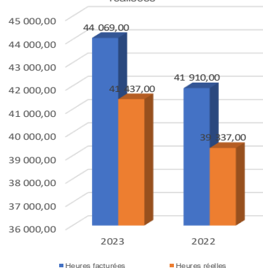
Comparaison heures facturées / heures réalisées